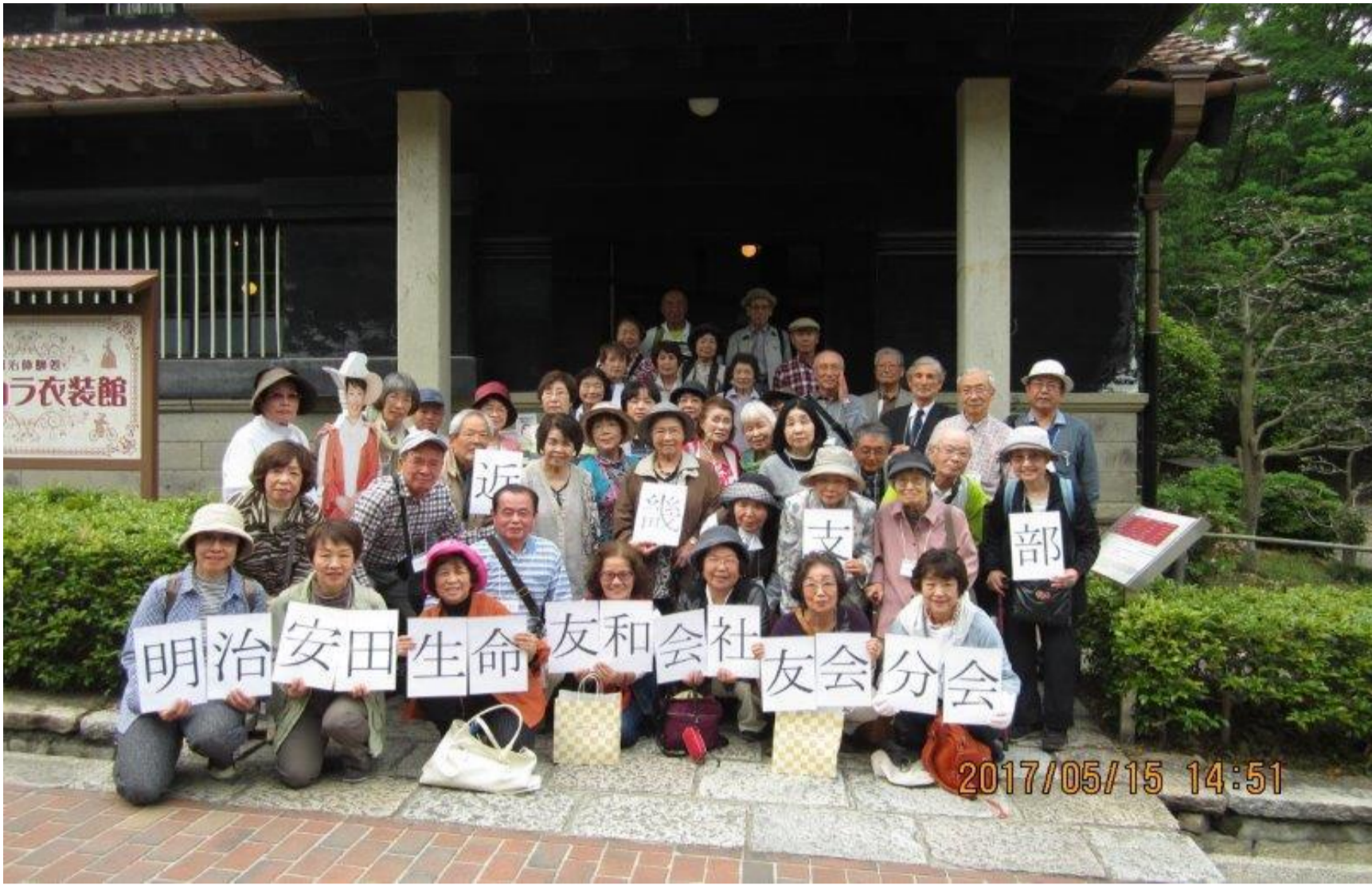
安田銀行会津支店前にて