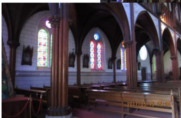
聖ザビエル天主堂