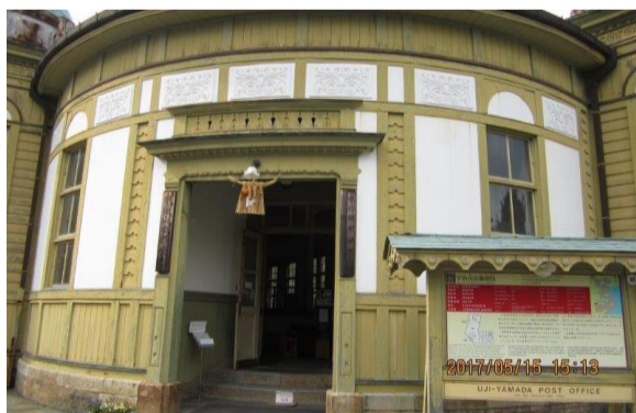
宇治山田郵便局舎（重要文化財）